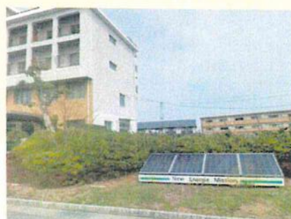
太陽光発電施設の設置・展示