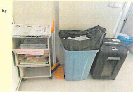
事務所ごみの分別排出