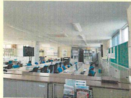
昼休みの一斉消灯