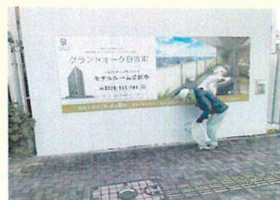
建設現場周辺の清掃活動