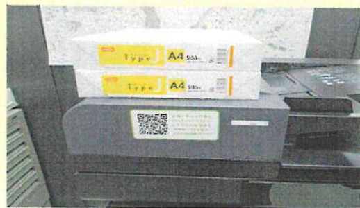
事務用品のグリーン購入(再生コピー用紙)