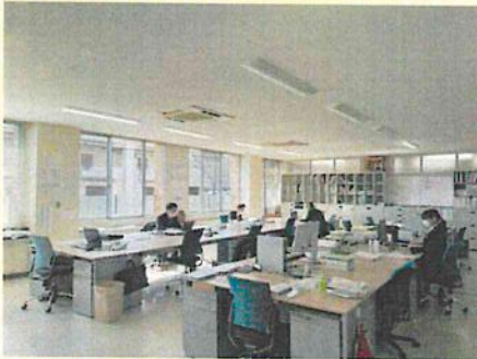
人のいないエリアの部分消灯