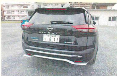
ハイブリッド車への更新