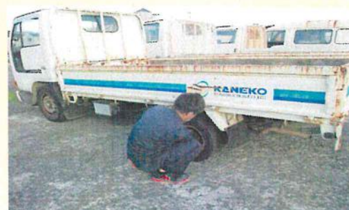
月 1 回の空気圧チェック