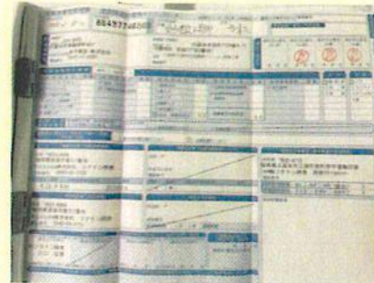
マニフェストの適正管理