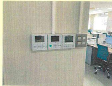
エアコン空調温度の管理