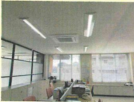
事務所内照明の LED 化