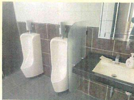
節水トイレと人感センサー